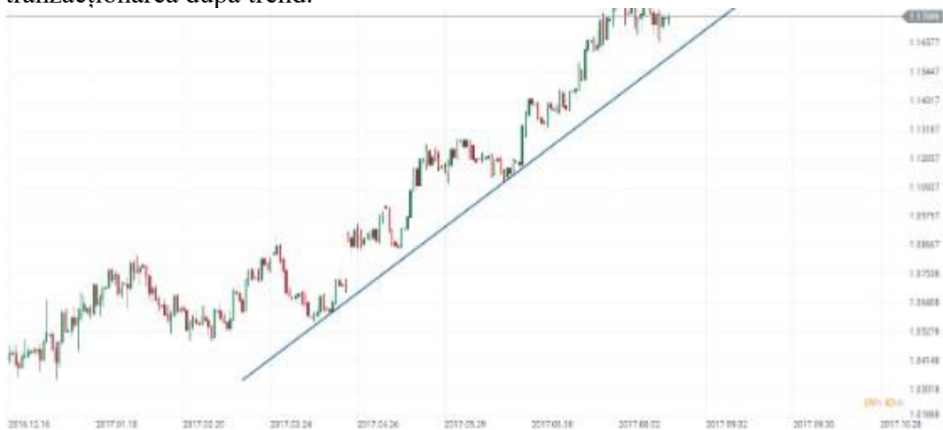
Figura 4. Tranzacționarea după trend

O altă strategie considerată de traderii de renume este strategia trendului. Atunci când privim o cotație valutară vedem o tendință de creștere sau scădere. Un exemplu de astfel de tranzacționare propun să analizăm în figura 4 privind tranzacționarea după trend.