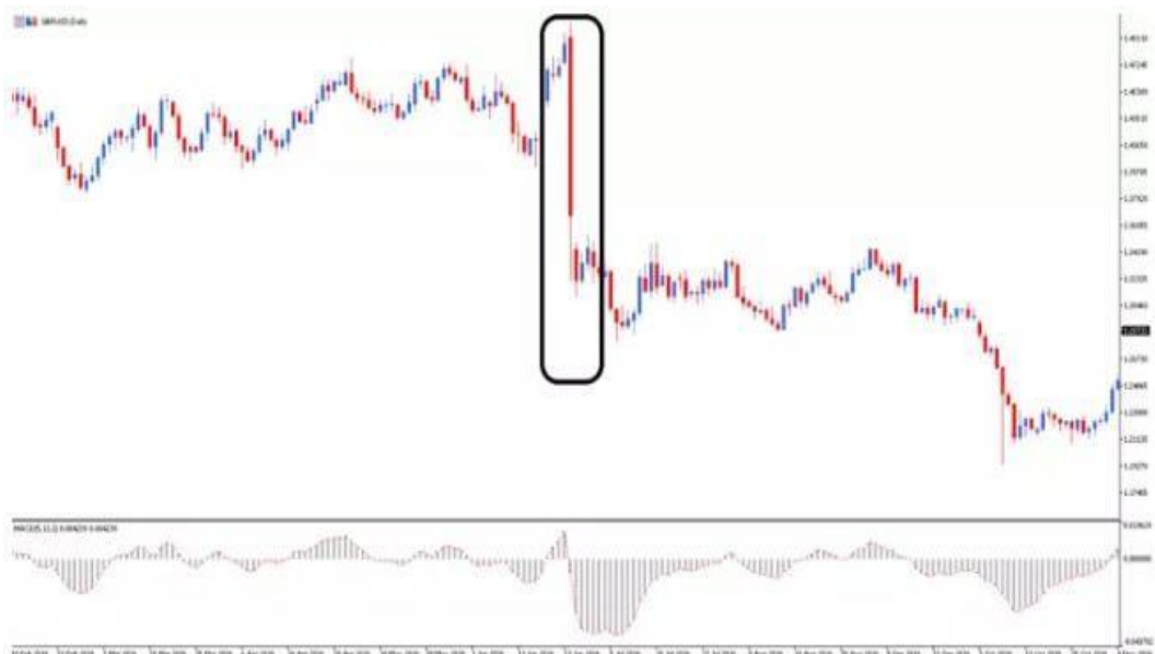
Figura 3. Hedging valutar și intrarea în tranzacție