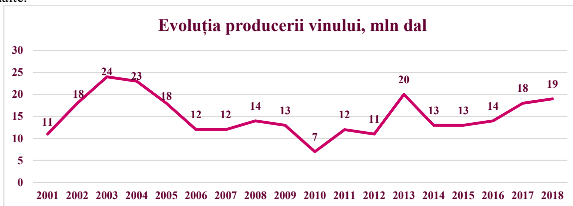
Figura 3. Evoluția producerii vinului, mln dal

nivel calitativ nou – producerea materialului de înmulțire și săditor viticol de categorii biologice înalte.