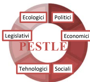
Figura 1. PESTLE – analiza mediului extern a companiei

CONȚINUTUL DE BAZĂ. Analiza PESTLE (cunoscută înainte sub denumirea PEST) reprezintă o structură sau un instrument pentru analiza și monitorizarea factorilor macroeconomici, care pot influența atât pozitiv, cât și negativ activitatea unei companii. 1 Acest instrument este deosebit de important în cazul deschiderii unei noi entități, sau în procesul de transnaționalizare a unei companiei, pentru studierea pieții externe.