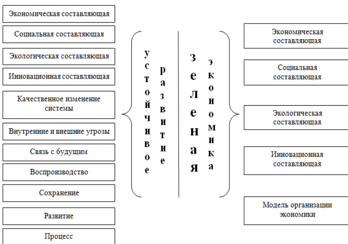
Рисунок 2. Характерные признаки понятий «устойчивое развитие» и «зеленая» экономика

Дальнейший анализ подходов авторов к определению понятий «устойчивое развитие» и «зеленая экономика» позволил выделить характерные признаки, которые авторы вкладывают в экономическую сущность данных понятий (рисунок 2).