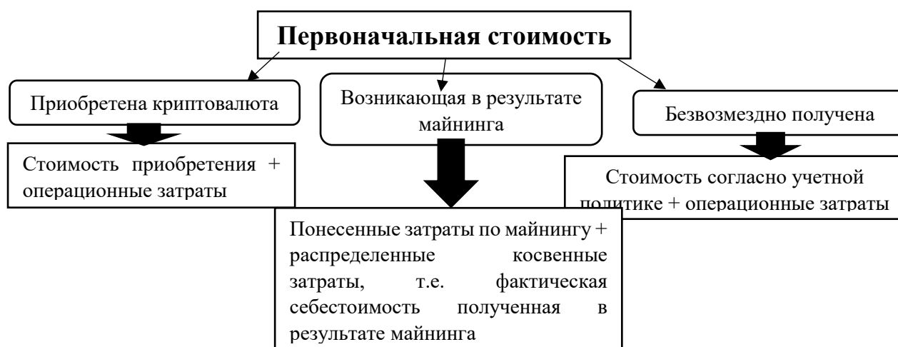
Рисунок 1. Формирование первоначальной стоимости

Примечание: собственная разработка на основе изучения нормативных документов и экономической литературы [10,11]