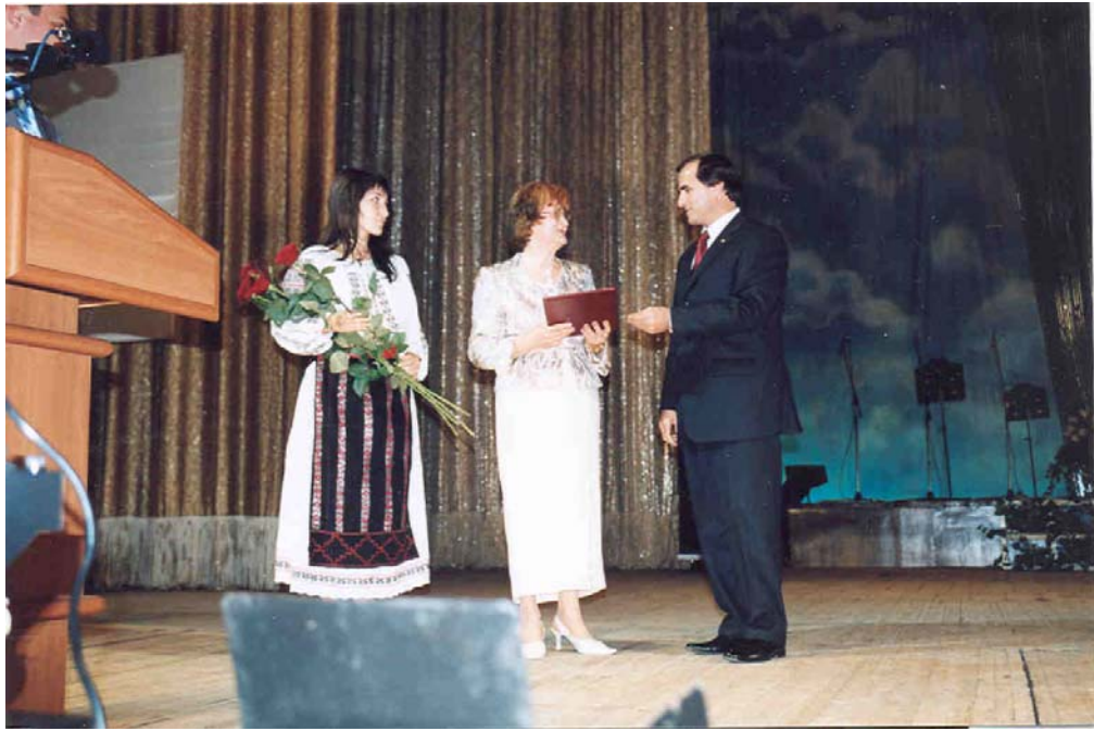
Nadejda Șican primește Diploma de gradul întâi a Guvernului Republicii Moldova, înmănată de prim-ministru Vasile Tarlev, 2007