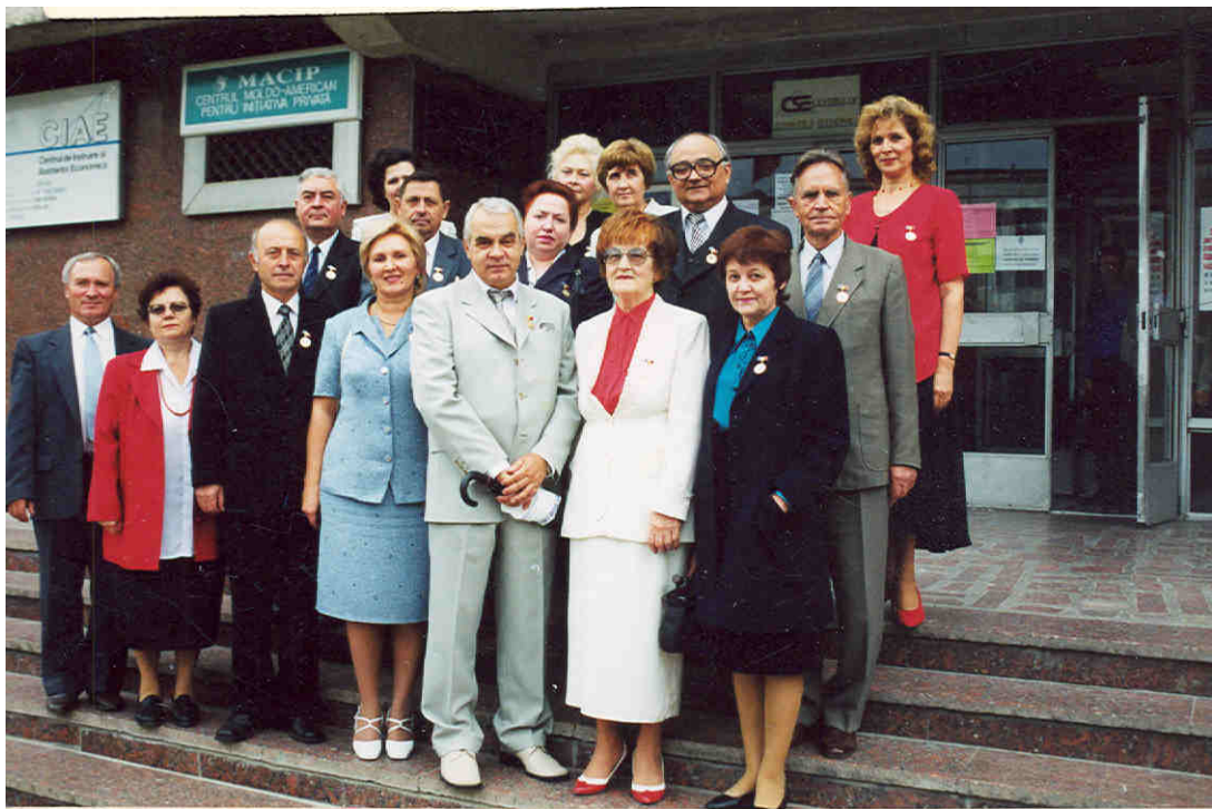
Colectivul facultății de Relații Economice Internaționale, ASEM