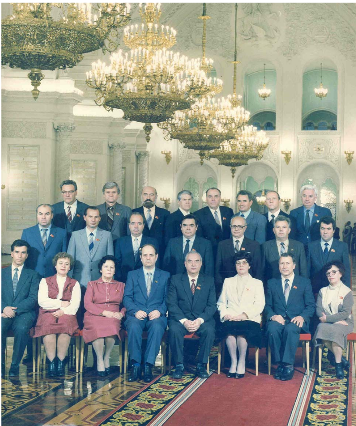
ВСЕСОЮЗНОЕ СОВЕЩАНИЕ ЗАВЕДУЮЩИХ КАФЕДРАМИ ОБЩЕСТВЕННЫХ НАУК ВЫСШИХ УЧЕБНЫХ ЗАВЕДЕНИЙ Москва, Кремль, октябрь 1986 года

Reuniunea șefilor catedrelor de științe sociale din învățământul superior, octombrie 1986, Moscova (N. Șișcan a șasea din rândul de jos)