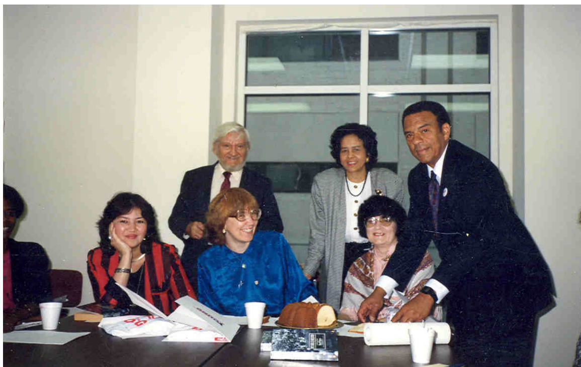
Seminarul URSS-USA „Problemele perfecționării învățământului în contextul factorului de gender”, 1990, Washington-Atlanta