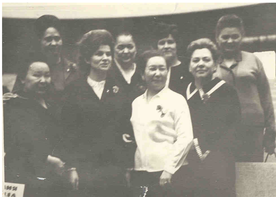
Nadejda Șișcan la o întâlnire cu Valentina Tereșcova, prima femeie astronaut, Moscova, 1970