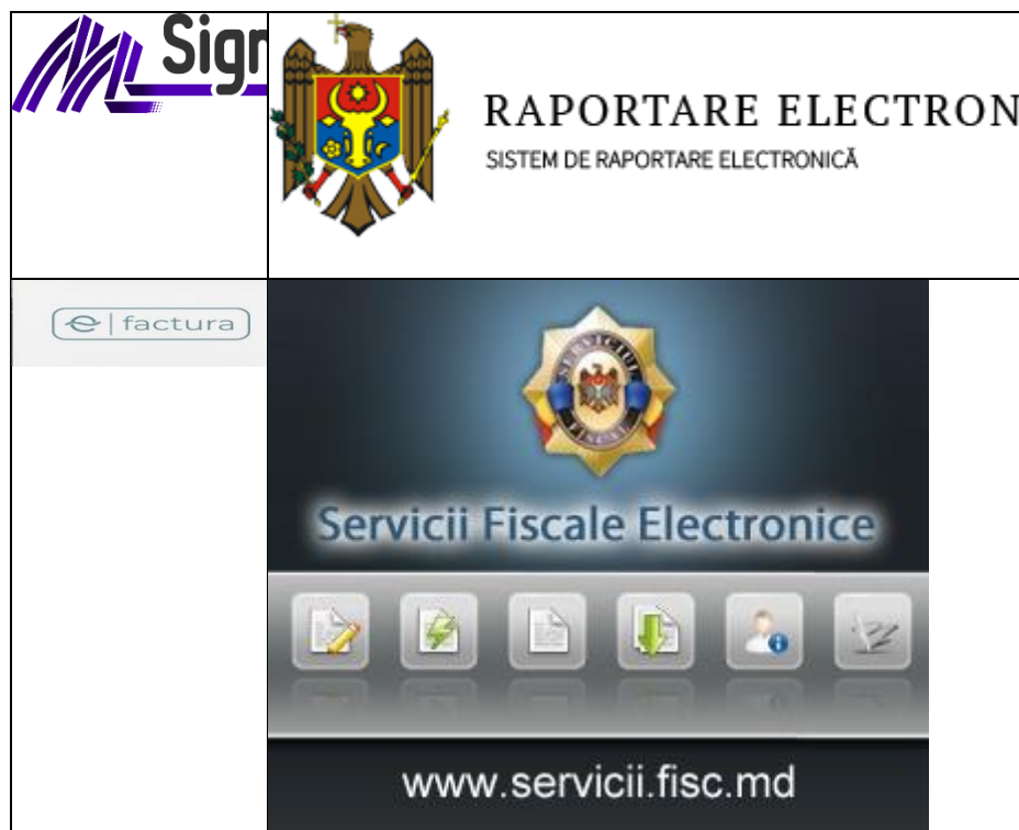
Figura 1. Platforme guvernamentale

pentru a face față pandemiei a fost implementarea distanțării sociale, determinând o reducere evidentă a documentelor în format fizic. Transformarea în format digital a circulației documentelor și rapoartelor la distanță în Republica Moldova se efectuează prin unele platforme guvernamentale. Un subiect de actualitate în mediul afacerilor este semnătura electronică. Legea nr. 91 din 29.05.2014 reglementează semnătura electronică și documentul electronic [5].