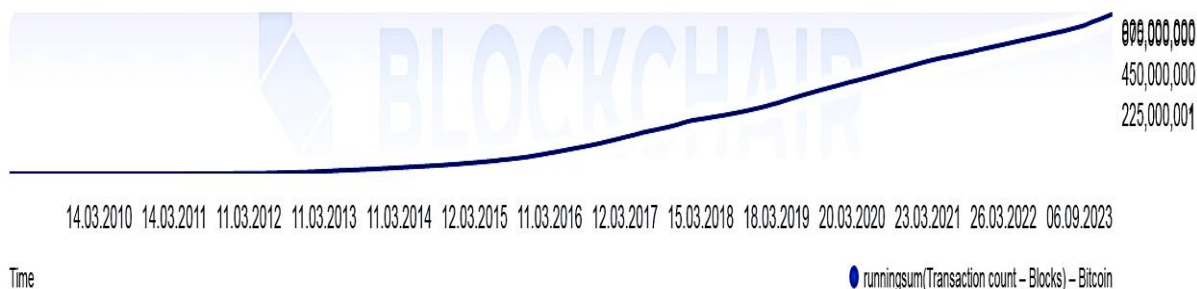
Figura 2. Numărul de tranzacții cu Bitcoin pe lună din 2009 până în 2023/