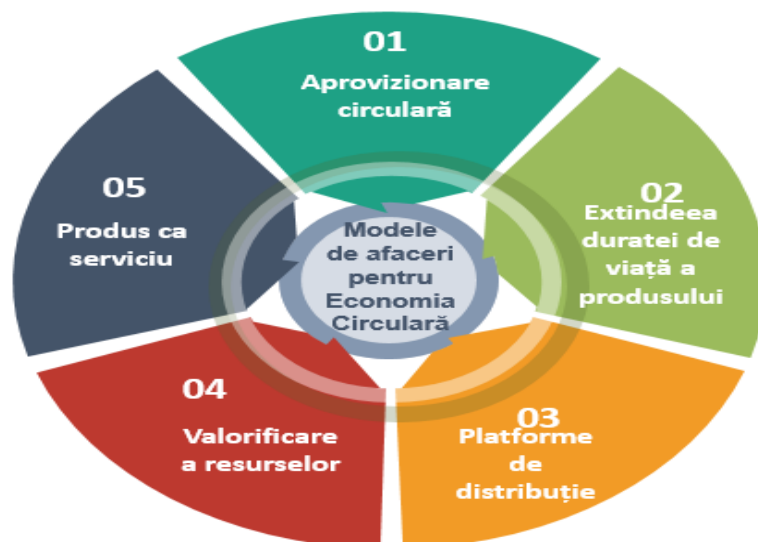
Figura 2. Metodele de afaceri pentru o economie circulară

Drept activități cheie necesare pentru tranziția către o economie circulară mai eficientă din punctul de vedere al resurselor sunt considerate modele de afaceri circulare. Aplicarea acestor modele va contribui la reducerea extracției și utilizarea resurselor naturale, precum și va genera deșeurile industriale și de consum. În literatura de specialitate găsim cinci modele principale pentru o economie circulară (OECD, 2018):