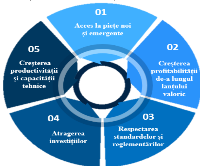
Figura 3. Factorii ce contribuie la crearea valorii adăugate din eco-inovare

Astfel, prin eco-inovare, Programul Națiunilor Unite pentru Mediu susține IMM-urile din regiuni în dezvoltarea și aplicarea unui model de afaceri care va permite crearea unor afaceri sustenabile pe tot ciclul de viață al acestora și pe parcursul întregului lanț valoric în care vor participa acestea. Eco-inovarea implică un set de modificări sau soluții noi pentru produse (bunuri/servicii), procese, analiza pieții și a structurilor organizaționale, care duc la îmbunătățirea performanței și competitivității unei companii. Această abordare poate ajuta întreprinderile mici și mijlocii (IMM-uri) să penetreze pe noi piețe, să crească productivitatea, să atragă noi investiții în afaceri, să crească profitabilitatea de-a lungul lanțului valoric și să le ajute să se conformeze reglementărilor și standardelor (UNEP – Eco-Innovation).