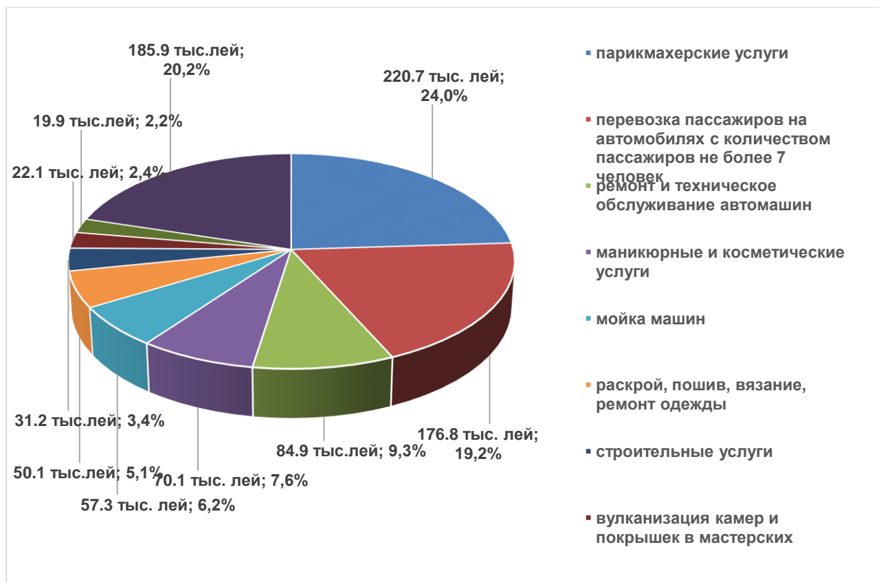
Рис. 4. Удельный вес поступлений от предпринимательских патентов по видам деятельности в сфере услуг за 2021 год.