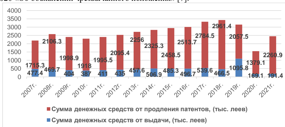
Рис. 3. Динамика суммы денежных средств от выдачи и продления предпринимательских патентов на территории АТО Гагаузия, (тыс. леев)

По данным, представленным на Рис. 3 можно отметить, что максимальная сумма поступлений в бюджет от выдачи и продления патентов приходится на 2018 год и составила 3427,9 тыс. леев и по сравнению с 2007 годом рост составил 156,33%. Значительное сокращение поступлений в 2020 году связано с тем, что в связи с пандемией, органами власти АТО Гагаузия патентообладатели были освобождены от внесения оплаты за патент с 17 марта по 31 декабря 2020 года. Во время пандемии COVID-19, руководство автономии приняло Закон АТО Гагаузия №54 «О мерах поддержки экономических агентов АТО Гагаузия, осуществляющих предпринимательскую деятельность на основе индивидуального предпринимательского патента». Данный Закон предусматривает освобождение патентообладателей от обязанности вносить плату за индивидуальный предпринимательский патент до 31.12.2020 года, деятельность, которых была приостановлена на период чрезвычайного положения, введенного Постановлением Парламента Республики Молдова №55/2020 «Об объявлении чрезвычайного положения» [7].