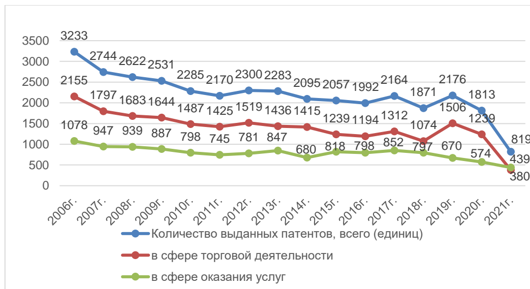
Рис. 1. Динамика количества выданных предпринимательских патентов на территории АТО Гагаузия, в том числе в сфере торговли и оказания услуг (единиц)