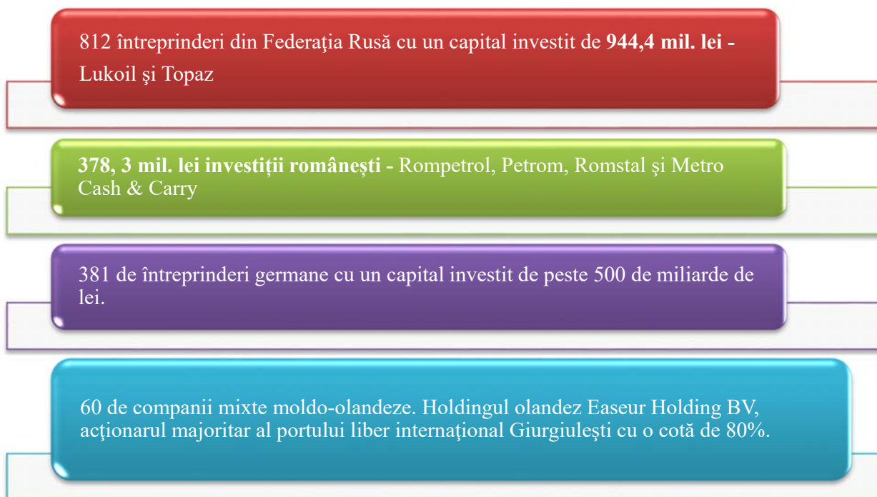
Figura 1.2: Topul celor mai mari plasatori de capital în Republica Moldova

Potrivit datelor Băncii Naționale a Moldovei, România, Italia și Franța conduc topul investitorilor cu cele mai mari investiții în capitalul social al băncilor, în timp ce alte sectoare (industria prelucrătoare, retail, telefonie) sunt dominate de plasatorii de capital din Federația Rusă, Olanda și SUA.