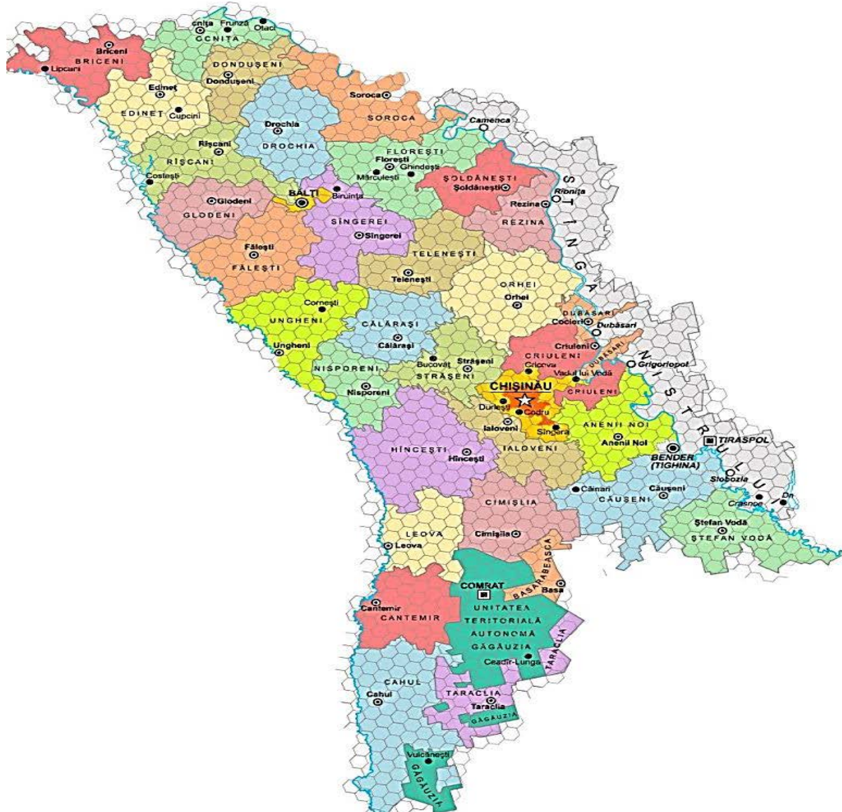
Figura 1. Harta RM divizată în zone teritoriale/ Figure 1. Map of RM divided into territorial areas

mijloacele de comunicații, chiar aflându-se în afara ariei de acoperire a rețelelor de comunicații electronice mobile. means of communication, even being outside the coverage of mobile electronic communications networks.