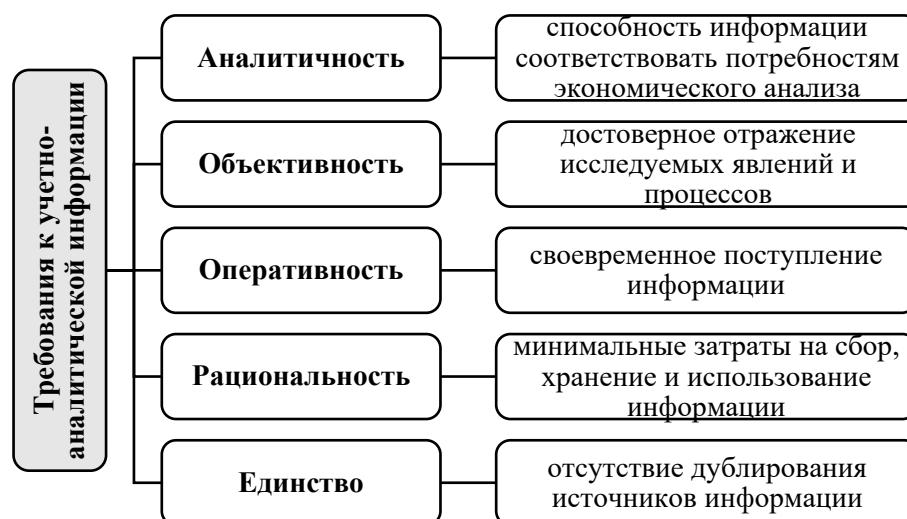
Рис.2. Требования к учетно-аналитической информации

Заключительный этап формирования учетно-аналитического обеспечения управления расходами характеризуется проведением анализа учетной и внеучетной информации [2]. Аналитические процедуры можно представить в виде определенной логической последовательности: расчет показателей динамики и структуры расходов, анализ затрат на 1 лей произведенной продукции, расчет критического объема продаж, факторный анализ расходов и анализ влияния расходов на прибыль и рентабельность хозяйствующего субъекта. На основе полученных данных формируется отчетность. В этой связи, информация, используемая в рамках учетно-аналитического обеспечения, должна соответствовать определенным требованиям, среди которых необходимо выделить: