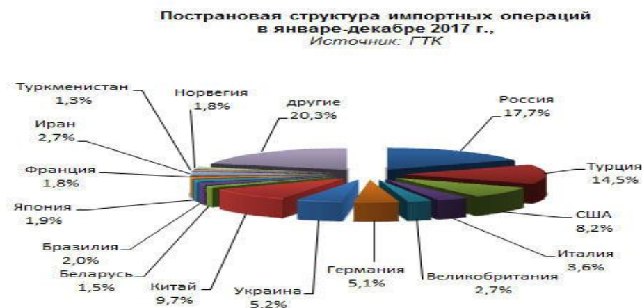
Рисунок 3. Пострановая структура импортных операций в 2018г.

Доля госсектора в экспорте составила 8,83 млрд. долл., частного сектора - 4,8 млрд. долл. США, физических лиц - 177,22 млн. долл..