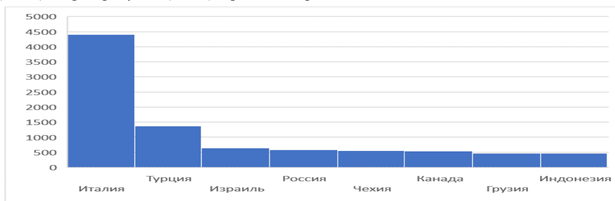
Рисунок 1. Основные страны –экспортеры азербайджанской продукции

Стоимостной объем экспорта Азербайджана в 2018 г. составил 13,8 млрд. долл.. Основными экспортными статьями Азербайджана в рассматриваемый период являлись сырая нефть (77,5 % от общего объема экспорта), природный газ (8,7 %), фрукты и овощи (3,6 %), нефтепродукты (2,5 %), прочие товары – 7,7 %.