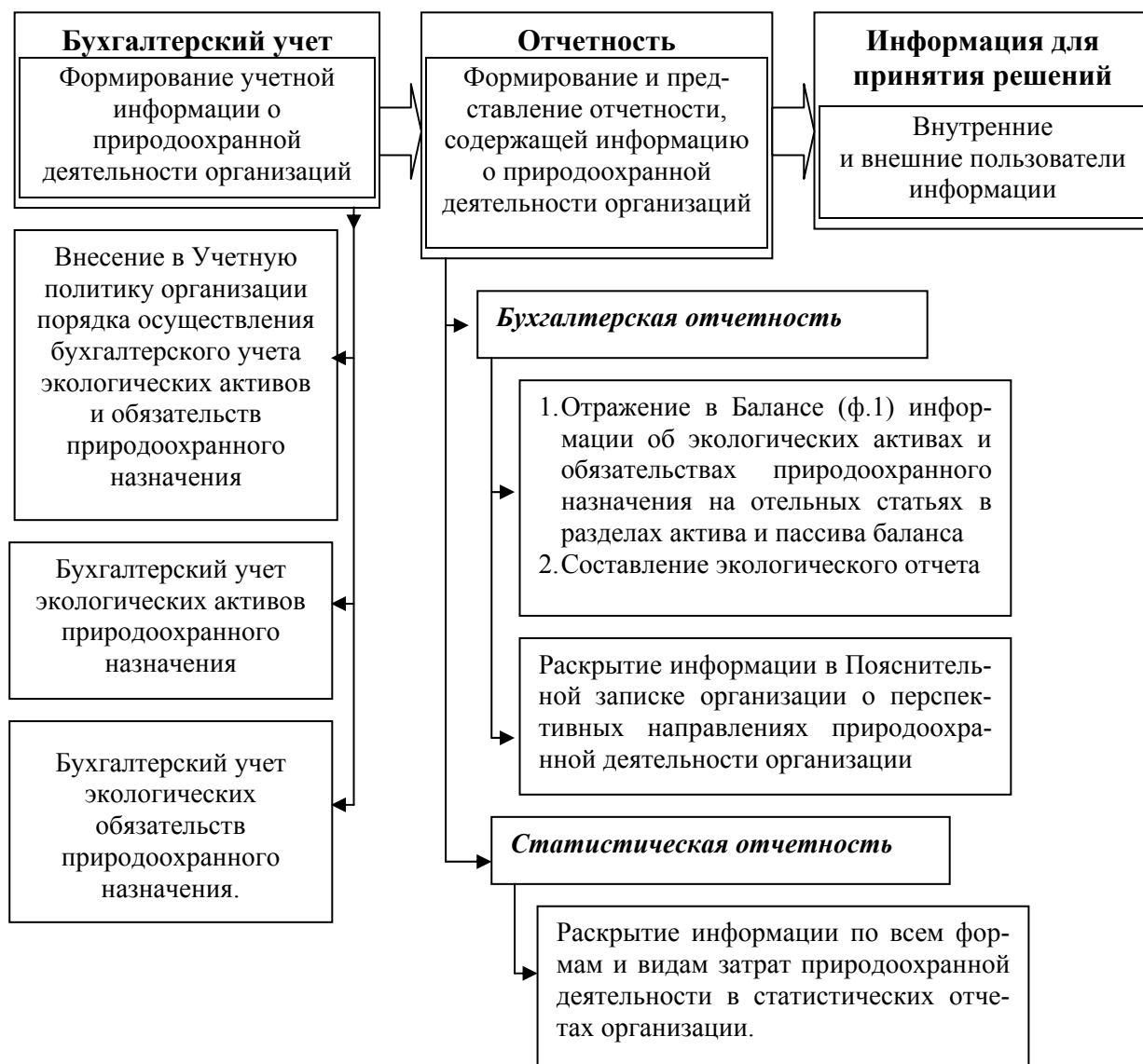
Рис. 2. Предлагаемые изменения учетно-аналитического обеспечения природоохранной деятельности организаций Республики Беларусь

Примечание: Собственная разработка на основе изучения нормативной и специальной экономической литературы.