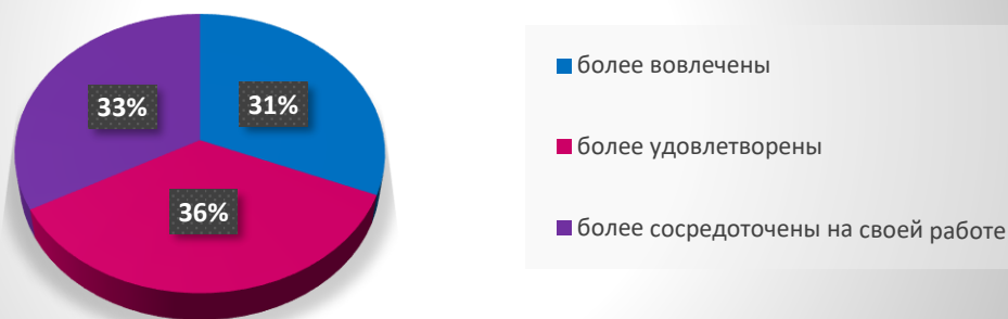
Диаграмма: выполнена автором на основе информации статьи

https://blog.gitnux.com/emotional-intelligence-statistics/#:~:text=Only%20about%2036%25%20of%20people,skill%20for%20every%20staff%20member.