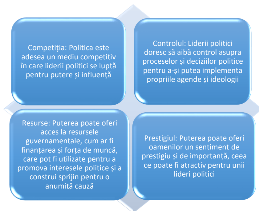
Figura 2. Factorii formării liderului nevoie de putere

În cele din urmă, nevoia de putere în managementul politic poate fi motivată de o varietate de factori personali și de circumstanțe politice, și poate varia de la lider la lider. Este important să se recunoască că puterea poate fi folosită în mod pozitiv sau negativ, în funcție de modul în care este utilizată și de scopurile pe care le promovează.